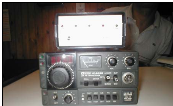
Το ICOM IC-245E και το TNC2 δώρα προς την ΕΡΔ από τους συναδέλφους του Μιλάνου.

Δεν είναι βέβαια μόνο αυτά .Πριν δύο χρόνια περίπου μας επισκέφθηκε και πάλι κουβαλώντας μαζί του ένα UHF repeater (δύο