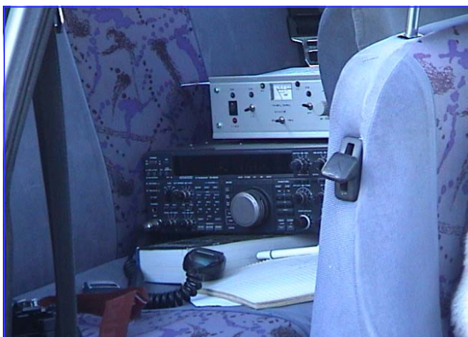
Το πρόχειρο αλλά αποδοτικό shack...