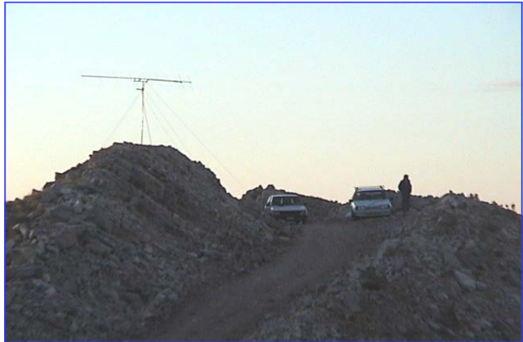
Η μοναξιά της κορυφής.....

Η κεραία τοποθετήθηκε με πόλωση 45 μοιρών.