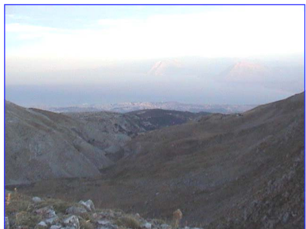
Πανοραμική θέα της Πάτρας.....